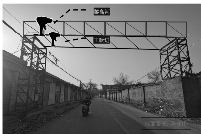
高处作业点位置示意图

经现场勘察,事故发生时所拆的管道过路桥架位置位于襄纺路原襄汾纺织厂女工楼东侧,其中管道东西方向大约长 11m,管道距离地面高度约 5.3m,3 种管道共 6 根;顶部支架东西方向长 10.07m 左右,支架高度 0.7m,宽度为 2.56m。