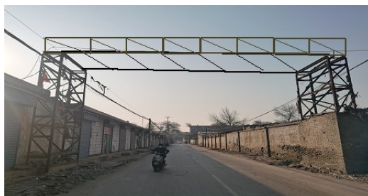
襄纺路纺织厂生活区管道过路桥架外观尺寸及高处作业点位置示意图